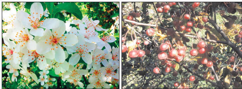
Рис. 9. Цветение (слева) и плодоношение (справа) M. Sieboldii .

тово-красные. Цветки интенсивно-розовые или пурпурные до 3–4 см в диаметре, чашелистики ланцетные. Плоды мелкие или средней величины (рис. 7).