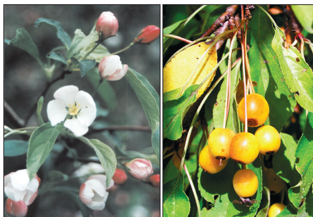
Рис. 5. M. sachalinensis с распускающимися цветками (слева) и плодами (справа).

В пятом квартале «Софиевки» растет очень привлекательная яблоня Недзвецкого M. niedzwetzkyana , представляющая собой дерево до 5–8 м высотой с шаровидной или эллиптической кроной и буровато-серой слаботрещиноватой корой. Многолетние ветви и стволы молодых деревьев темно-пурпурные или красно-бурые. Летние побеги толстоватые, темно-пурпурные или почти черные. Молодые листья темно-зеленые с красноватым оттенком, иногда фиоле-