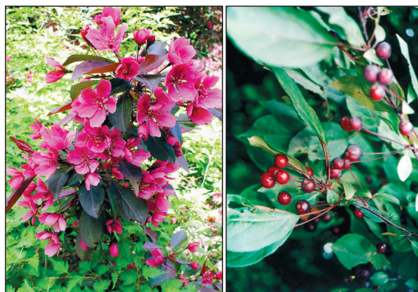
Рис. 6. Ветви M. halliana с цветками (слева) и плодами (справа).