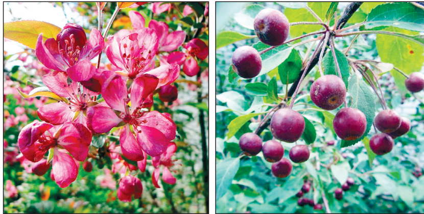
Рис. 8. Цветение (слева) и плодоношение (справа) M. purpurea .