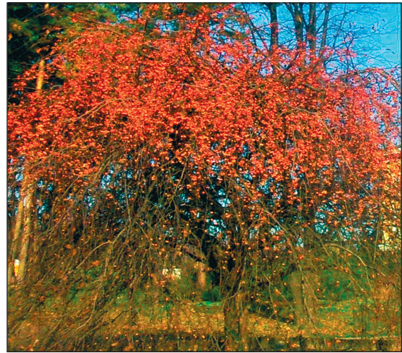
Рис. 2. Цветущее (слева) и плодоносящее (справа) дерево, предположительно Malus × gloriosa Lemoine ‘Oekonomierat Echtermeyer’ (2013).