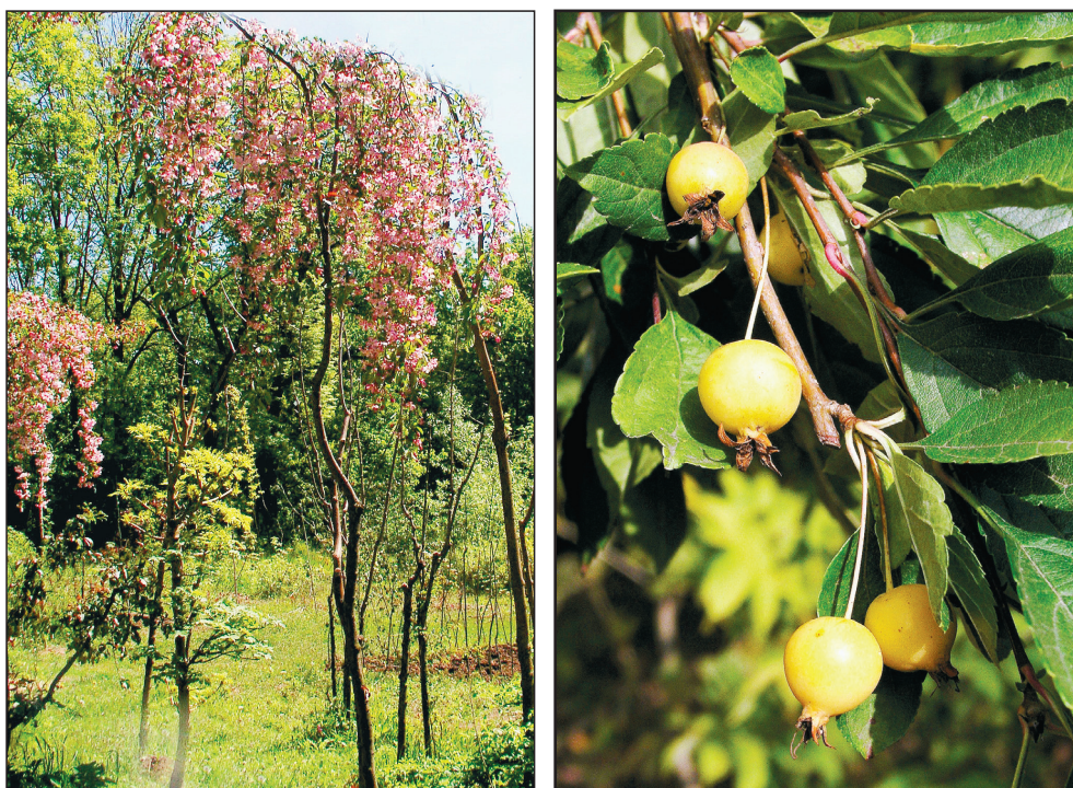
Рис. 4. M. baccata (L.) Borkh. f. pendula Zbl. с бутонами и цветками (слева) и плодами (справа).

Яблоня Холла M. halliana – дерево до 5 м высотой с правильной, округлой раскидистой кроной. Ветви красновато-коричневые, побеги голые или сначала слабоопушенные. Взрослые листья темно-зеленые, блестящие, молодые более или менее пурпурно окрашенные, черешки 0.5–2.0 см длиной. Плоды шаровидные, иногда грушевидные, 6–8 мм в диаметре, красно-пурпурные (рис. 6).